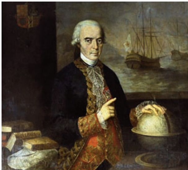
Retrato de Ulloa. (Museo Naval de Madrid).

diano que habían elegido y acababan de medir. Aquellas observaciones astronómicas habían empezado a finales del año 1738 y se prolongaron hasta 1740. Pero cuando en abril de 1740 parecía que ya estaban casi terminadas, aparecieron errores en las lecturas astronómicas por defectos de los instrumentos utilizados, por lo que decidieron repetirlas. Entre los instrumentos defectuosos se encontraba un observador cenital del Sol, en el que una larga estructura de unos 12