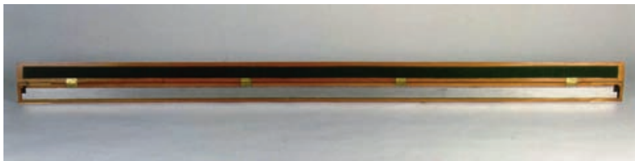
Reproducción de una toesa, antigua medida de longitud equivalente a 1,946 metros. Las toesas fueron utilizadas por los científicos de la medida del meridiano. (Museo Naval de Madrid).

jo de zapa, vadeo de barrancos, desbrozado, arranque de arbustos, etc. Las mediciones de la longitud exacta de dicha base comenzaron el 8 de octubre de 1736 y se prolongaron hasta el 5 de noviembre, con lo que obtuvieron la dimensión de uno de los lados del primer triángulo. En las cercanías de Cuenca se levantó otra línea terminal comprobatoria.