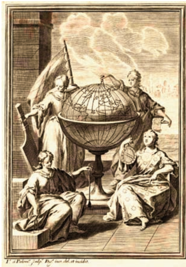
Grabado publicado en el libro Observaciones astronómicas y físicas hechas en el Reino del Perú.

tenga un buen rendimiento es necesaria la armonía del grupo, o al menos el deseo de cooperación, aparcando inquinas personales, lo que no se dio en esta ocasión. Bajo el punto de vista de los franceses, Godin, responsable de la expedición, se convirtió en un tirano científico, a la vez que fue un dilapidador de dinero, continuamente enfrentado a Bouguer y La Condamine, los que por otra parte a lo largo de la expedición dejaron de hablarse y de trabajar juntos. Al final, Godin fue expulsado de la Academia de Francia, se quedó en Perú como profesor y posteriormente fue el director de la Escuela de Guardia Marinas de Cádiz gracias a la amistad y buen entendimiento con Jorge Juan, que había sido su compañero de grupo durante las mediciones.