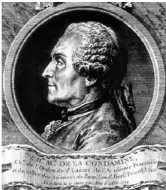
Retrato de La Condamine en un grabado de época.

Los expedicionarios también empezaron a sufrir las